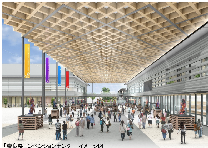
「奈良県コンベンションセンター」イメージ図

本県では、2020年に2,000名規模のMICE開催が可能な「奈良県コンベンションセンター」がオープンすることから、これを中・大規模MICEを誘致する好機と捉え、「誘致力の強化」に注力し、MICEが地域にもたらす効果を得られるよう施策を進めているところです。